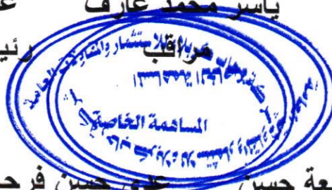
عمار جمعة حسن مندوباً دائرة تسجيل الشركات